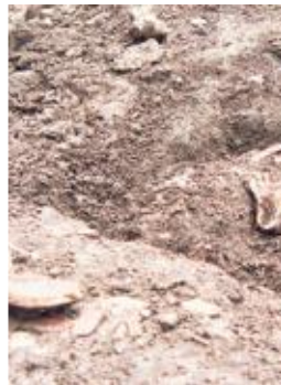
El martes unos niños encor